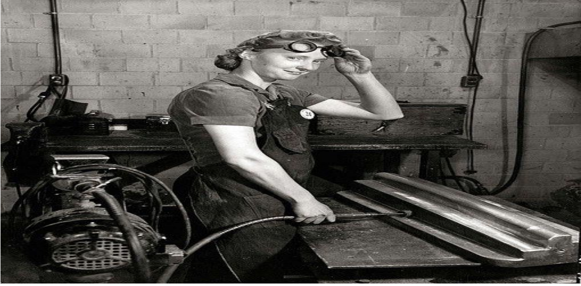
Fotoğraf 3: 1. Birinci Sanayi Devrimi'nde Fabrikanın Bir Biriminde Çalışan Kadın İşçi