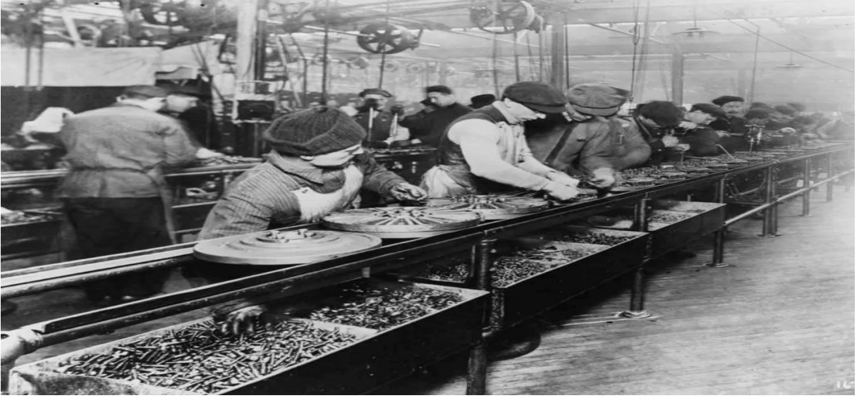
Fotoğraf 5: Birinci Sanayi Devrimi'nde Fabrikada Montaj Yapan İşçiler

işçiye güvenmez ve denetim mekanizmasını elinde tutar. Özellikle ortada bulunan nezaretçinin beden dili değerlendirildiğinde denetimini tehditkâr, hesap sorucu bir ifade ile gerçekleştirdiği söylenebilir. Bu tehditkâr tavır çocukların üzerinde baskı yaratarak, yapılan bu tehlikeli işte iş kazası doğmasına neden olabilmektedir. Fotoğrafta dikkat çeken unsurlardan biri de çocuk işçilerin tezgâh üzerinde karşılıklı yönde yerleştirdikleri ve kullandıkları makinenin çapraz kurulmasıyla birbirlerinin işine engel olma ihtimali ortadan kaldırılmış, tezgahlar arası belirgin mesafeler bırakılmıştır. Bu durum Taylor'un hareket etüdüünün bu ve buna benzer işletmelerden doğduğunu göstermektedir.