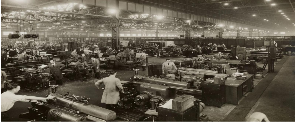
Fotoğraf 1: Birinci Sanayi Devrimi'nde Fabrikada Çalışan Erkek İşçiler

Araştırmada web üzerinden elde edilen birinci sanayi devrimine ilişkin görseller gösterge-gösteren-gösterilen kategorileriyle literatür ve Taylorizm dayanak alınarak yorumlanmıştır.