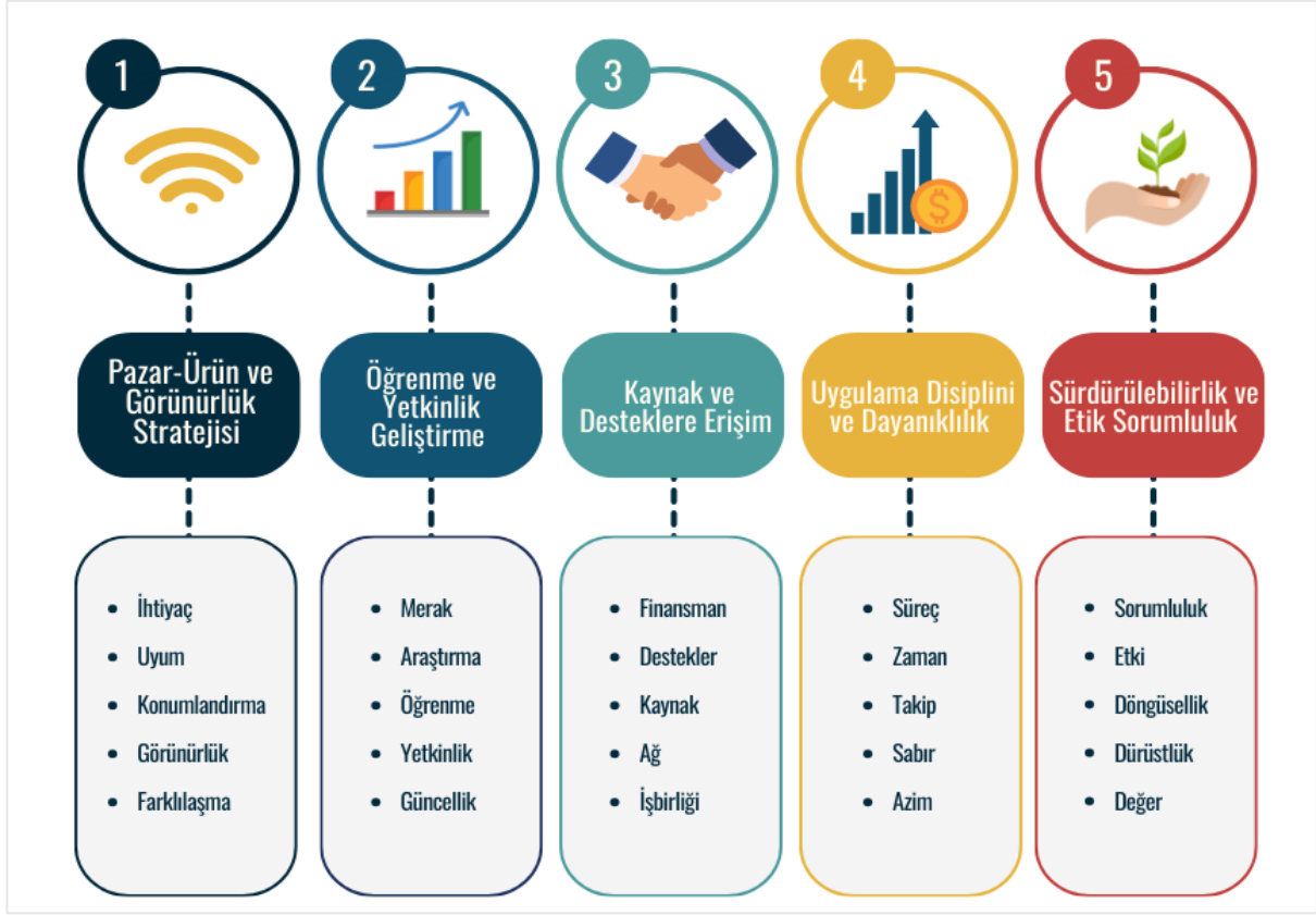
Şekil 3: Sürdürülebilir Girişimci Öneri Seti

Çalışmanın nitel yapısı ve belirli bir bağlamda yürütülmüş olması dolayısıyla bulguların genellenebilirliği sınırlıdır. Gelecek araştırmalarda, farklı ülke ve farklı girişim-sürdürülebilir girişim türlerinde benzer deneyim temelli analizler gerçekleştirilmesi, elde edilen ana temaların karşılaştırılmasına ve teorik çerçevenin geliştirilmesine katkı sağlayacaktır. Ayrıca nicel ve karma yöntemli araştırmalarda söz konusu temaların girişim başarısı üzerindeki etkilerinin test edilmesi, sürdürülebilir girişimcilik literatürüne önemli bir açılım sunabilir. Bu doğrultudaki gelecek araştırmacılar için öneriler aşağıda sıralanmıştır.